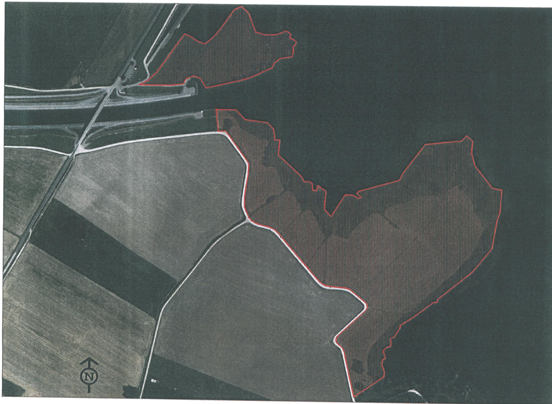
Annexe 4 : vue aérienne (échelle : 1/5 000)